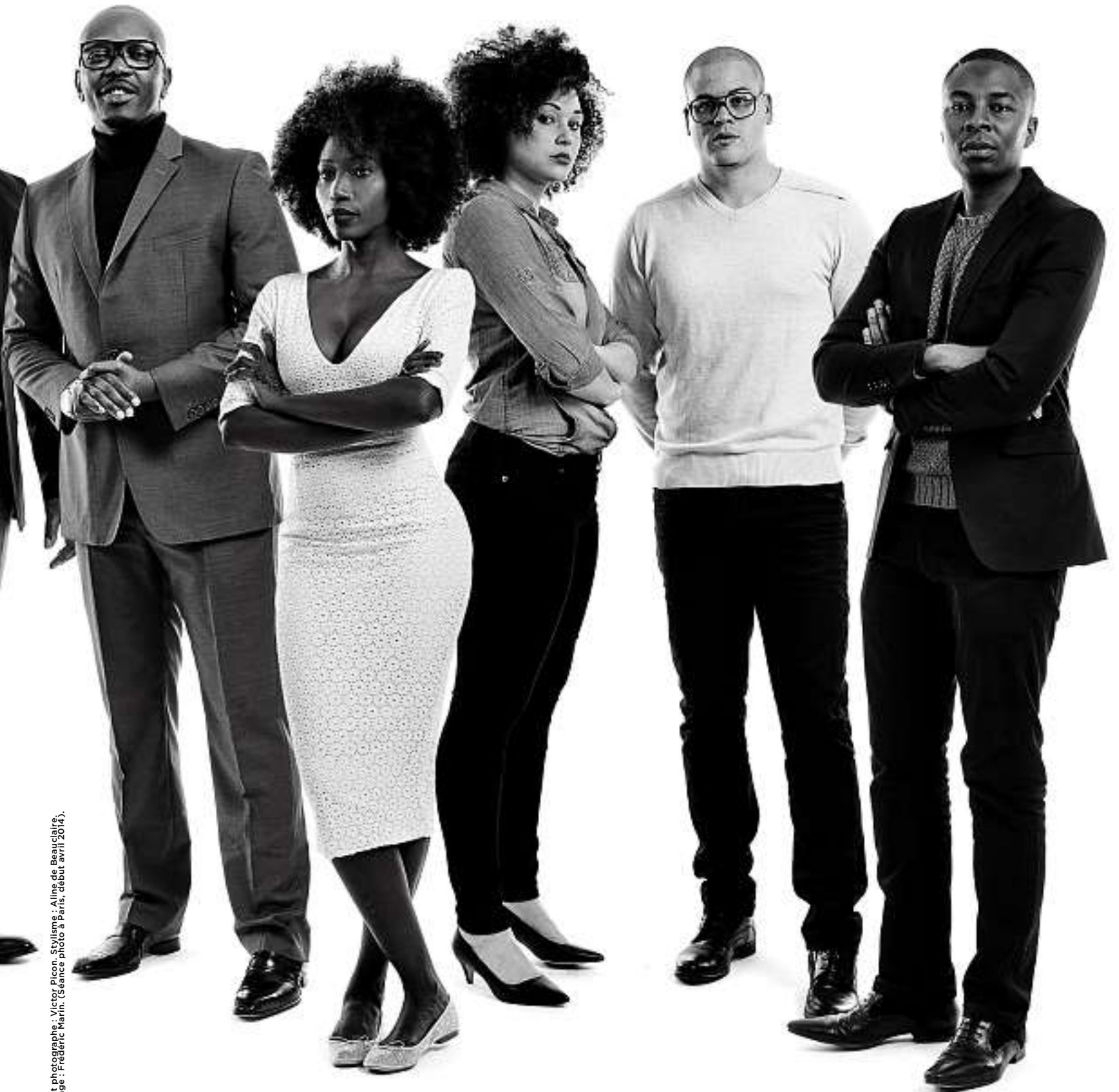
Assistant photographe : Victor Picon. Stylisme : Aline de Beauclair. Maquillage : Frédéric Marth. (Séance photo à Paris, début avril 2014).