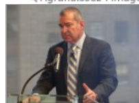
Jim Avila, journaliste à ABC

La réforme de l'immigration passe un cap important au Sénat américain